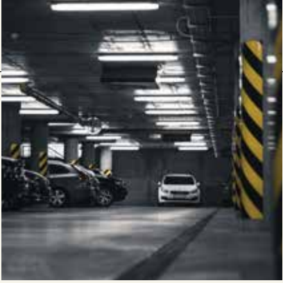
OTOPARK VE GÜVENLİK