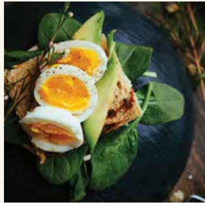
RESTORAN VE KAFELER