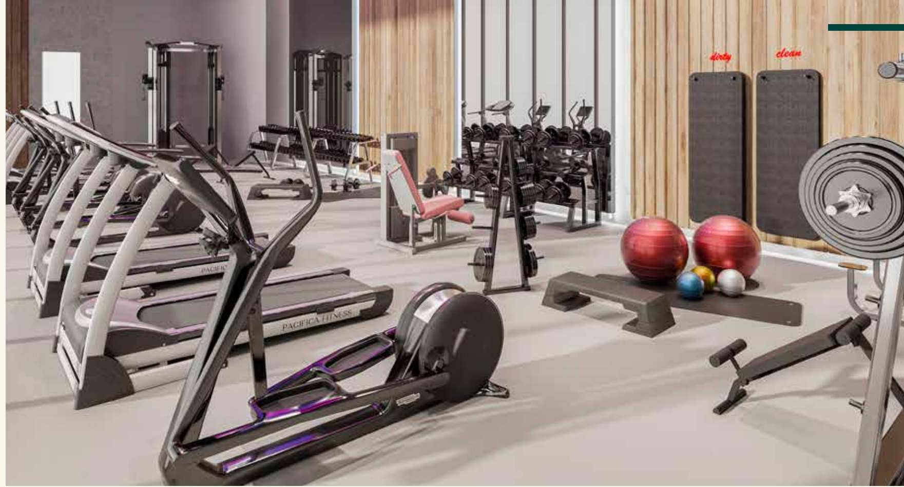
SPOR VE FITNESS ALANLARI