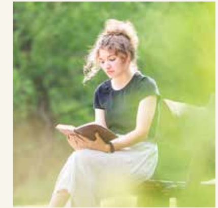
MANZARA VE DİNLENME NOKTALARI