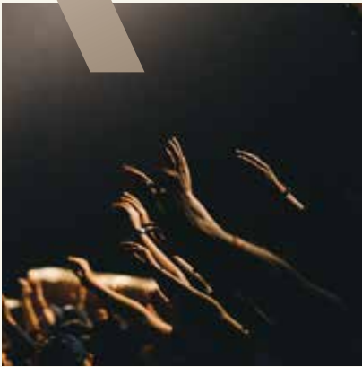
KONSER VE EĞLENCE ALANI