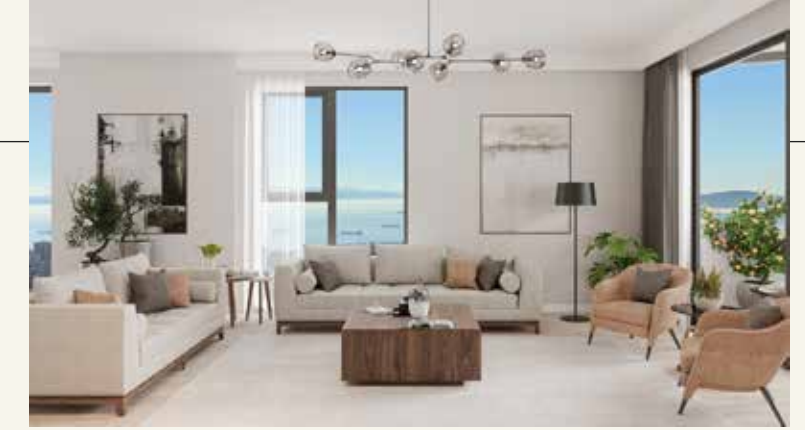
FERAH YAŞAM ALANLARI