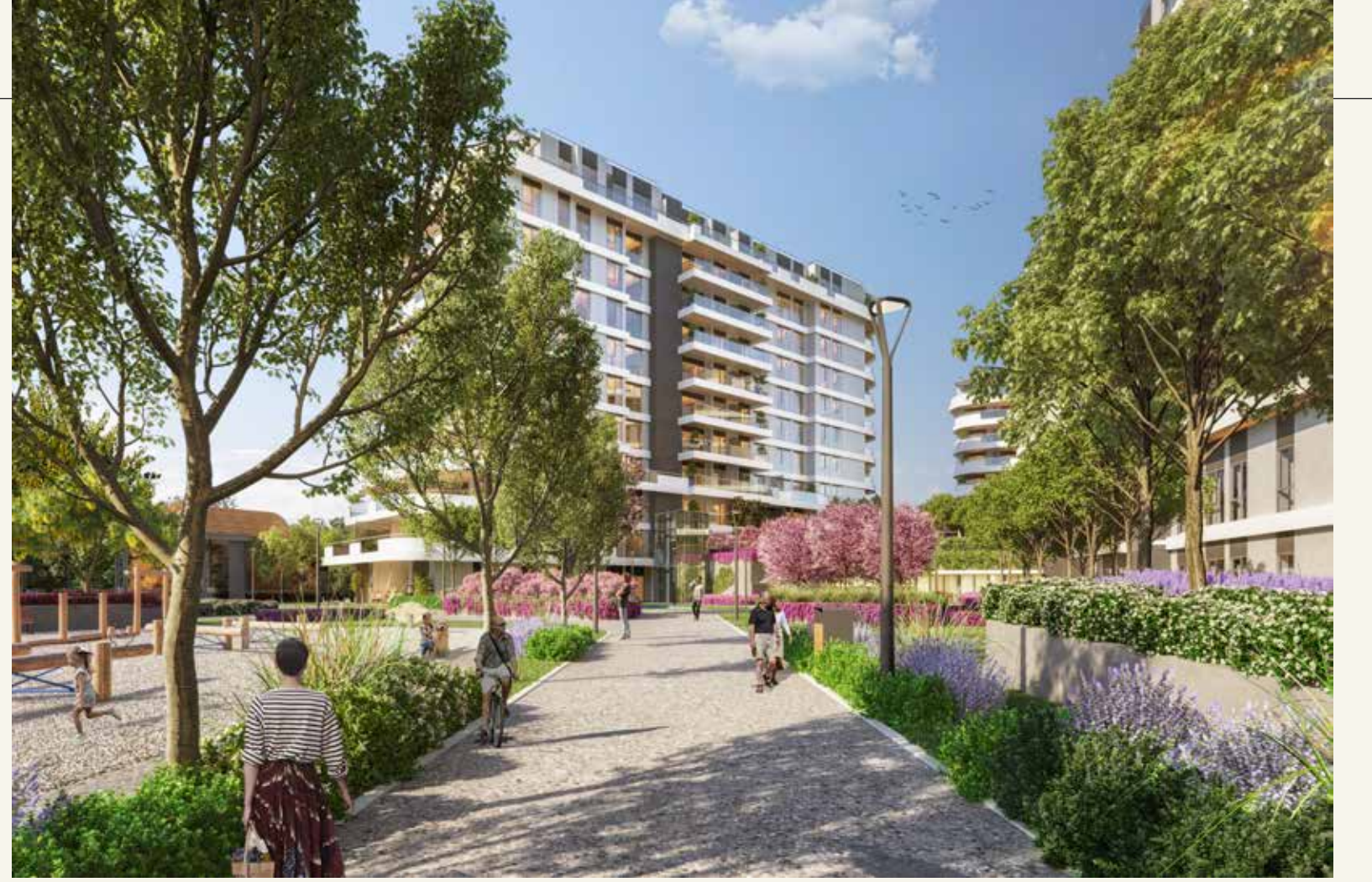
FERAH PEYZAJ ALANLARI