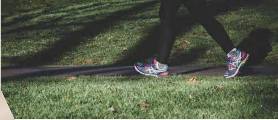
BİSİKLET VE YÜRÜYÜŞ PARKURLARI