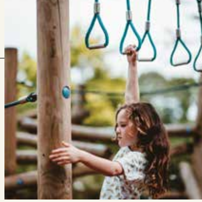
ÇOCUK OYUN ALANLARI