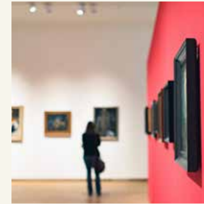
KÜLTÜR - SANAT ALANLARI