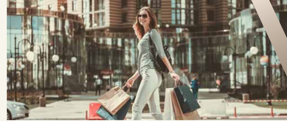
TİCARİ ÜNİTE VE MAĞAZALARA SAHİP ALIŞVERİŞ CADDESİ